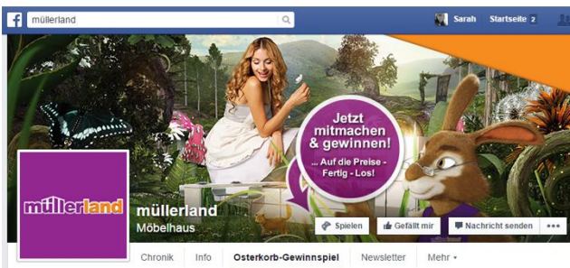
Ganzheitlicher Facebook-Auftritt zur Oster-Aktion