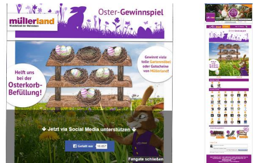
Das Osterkorbschießen 2015