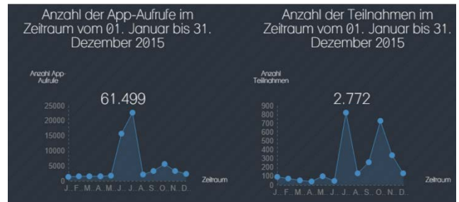
Anzahl der App-Aufrufe und Teilnehmer 2015