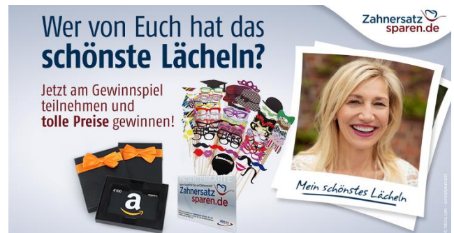
Das schönste Lächeln gewinnt!